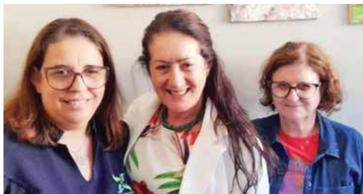
Enfeitando a coluna as super profissionais do Departamento de Saúde de Mococa. Obrigado por tudo!