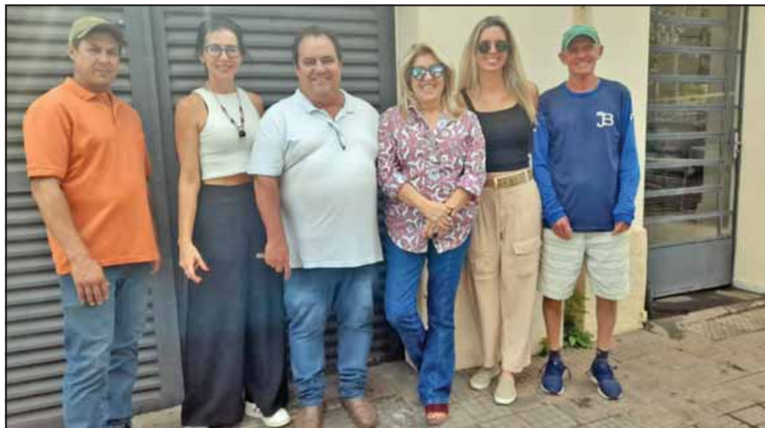
Pessoas que fazem acontecer por Mococa. Clicados pelo Giro da Fofa