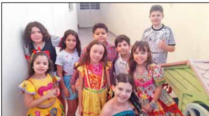
Encerrando o mês de Julho com crianças queridas. Que satisfação podermos compartilhar momentos tão gostoso em família. A criança brincando, quer coisa mais gratificante.