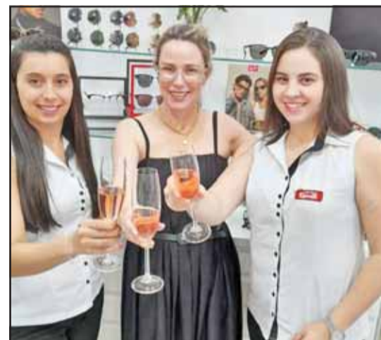
Parabéns Mococa engrandecida Óticas Renata, 7 anos nos agradando no setor de óticas em Mococa. Sucesso!