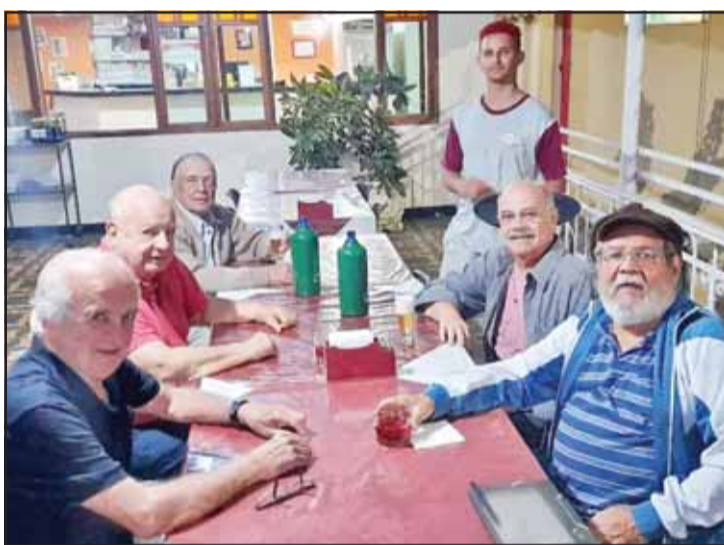
E Giro da Fofo encerrando o mês de Julho com esses amigos e grandes políticos enfeitando a coluna. Parabenizo a cada um pela belíssima amizade e compartilhar encontros. Amizade é tudo